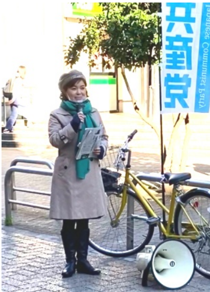
朝の駅頭宣伝でも「核兵器禁止条約に参加する政権をつくりましょう」と呼びかけています。(5日、西荻窪駅)

日本政府がこうした態度をあらため、すみやかに核兵器禁止条約に署名・批准することを強く求めるとともに、多くの人と連帯し、核兵器禁止条約に参加する新しい政権をつくるため、私も全力を尽くす決意です。