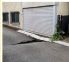
住民から通報を受けた時の様子(上)。現地に駆けつけた際には、陥没が発生していた(右)。

陥没を埋め戻すために投入された砂は約140立法メートル。応急復旧作業は19日朝まで続き、搬入車両は2tトラック50台を越えた。