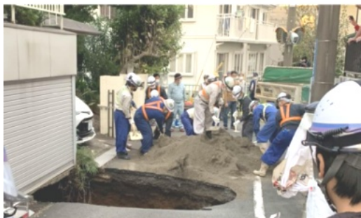
隣接住宅の倒壊を防ぐため、緊急の埋め戻し作業が行われました。